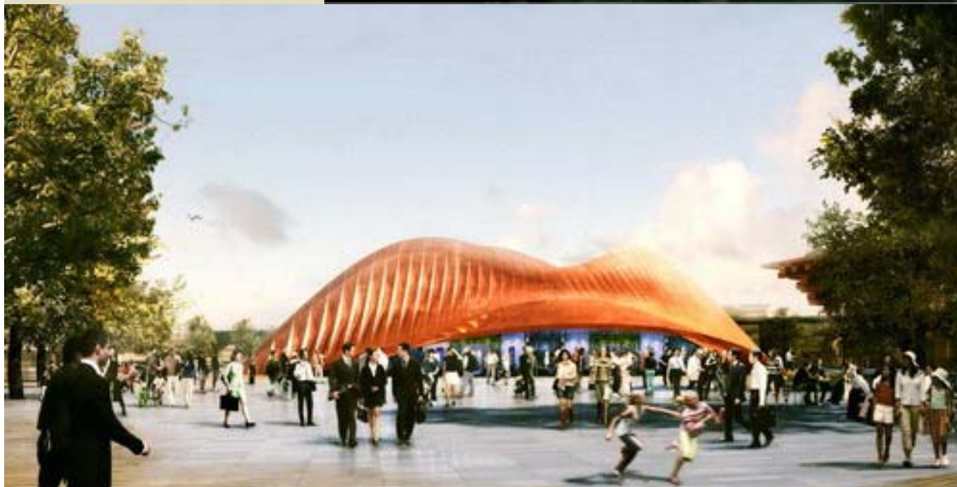
阿拉伯聯合大公國館